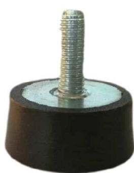
PIEDINO A VENTOSA (con vite o dado di fissaggio)